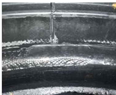
图5 胎圈大边消失、胎圈疤痕存在

间。现场使用的隔离剂有水溶性和油溶性两种,由于成本问题,一般情况下使用水溶性隔离剂的较多。以9.00-20 Q-2轮胎为例,分别采用水溶性隔离剂和油溶性隔离剂生产10条轮胎,成品轮胎的胎圈质量问题并没有明显差异,油溶性隔离剂能起到一定缓解作用,可以推广使用油溶性隔离剂。