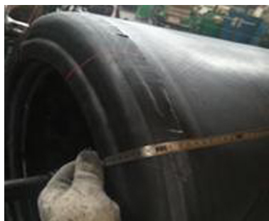
图4 成型过程中控制25 mm的贴合高度