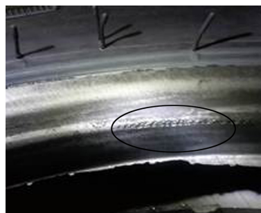
图 1 胎圈疤痕