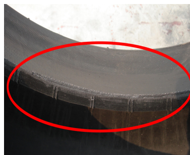
图 2 胎圈大边

品;对于无内胎轮胎则胎圈顺胎趾边部修剪整齐,不出现锯齿状,不伤及线层的为合格品。